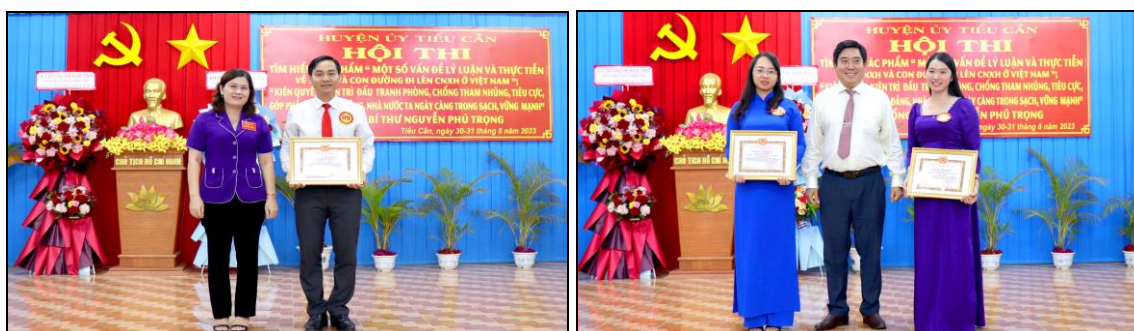
*Ảnh 3,4: Các thí sinh đạt giải nhất, nhì Hội thi tìm hiểu nội dung tác phẩm của Tổng Bí thư Nguyễn Phú Trọng