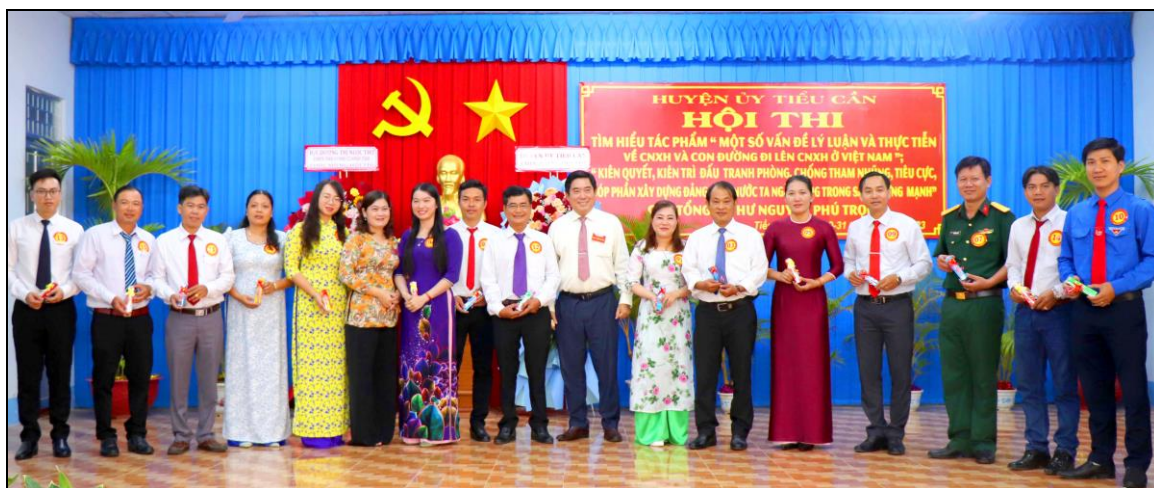
Lãnh đạo BTG Tỉnh ủy, Huyện ủy và các thí sinh tham gia Hội thi tìm hiểu tác phẩm của Tổng Bí thư Nguyễn Phú Trọng.