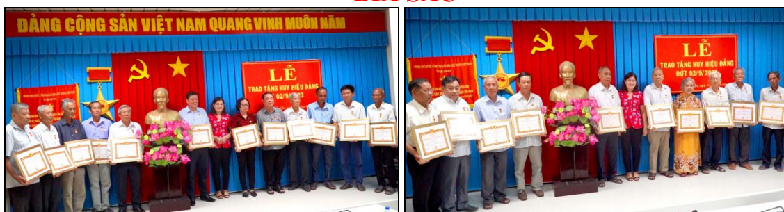
*Ảnh 1,2: Trao Huy hiệu Đảng đợt 2/9 cho 23 đảng viên đủ điều kiện