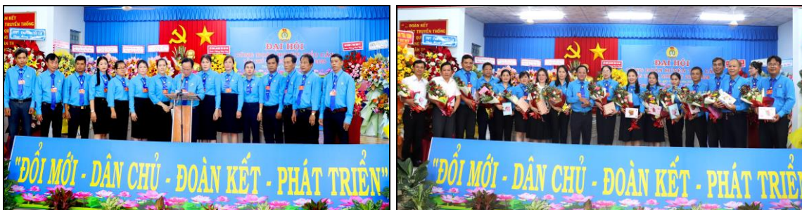
*Ảnh 3: BCH Công đoàn huyện Tiểu Cần, nhiệm kỳ 2023 – 2028 ra mắt