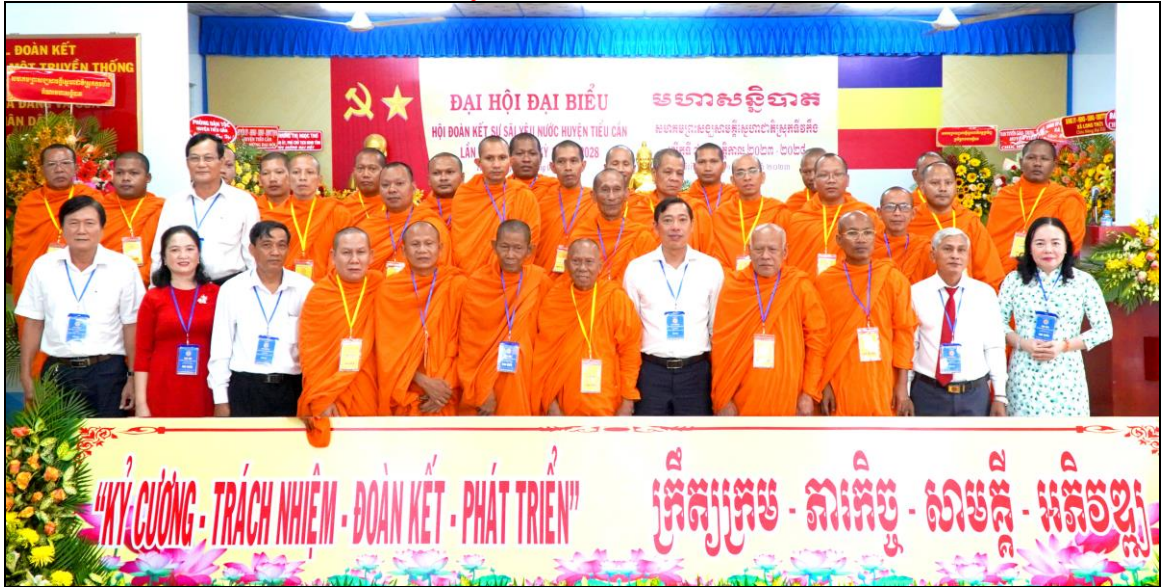
Lãnh đạo tỉnh, huyện và Ban chấp hành Hội ĐKSSYN huyện Tiểu Cần, nhiệm kỳ 2023 - 2028